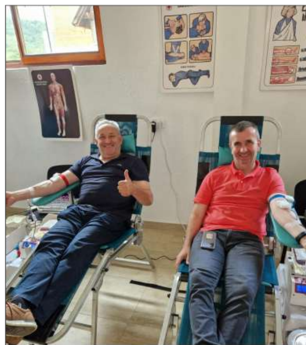
Пише: Вања Пејаковић

У Котор Варошу има више од 800 добровољних давалаца крви, а ову акцију организовао је општински Црвени крст, уз подршку привредника и локалне управе.