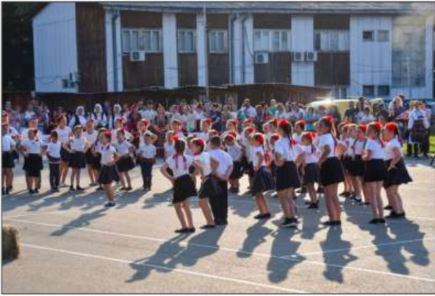
ФОТО ГАЛЕРИЈА: САБОР ФОЛКЛора