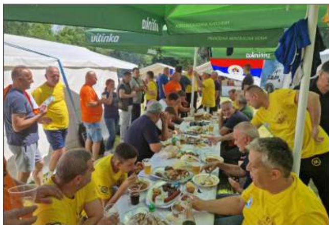
ФОТО ГАЛЕРИЈА: КОТОРВАРОШКА КОТЛИЋИЈАДА