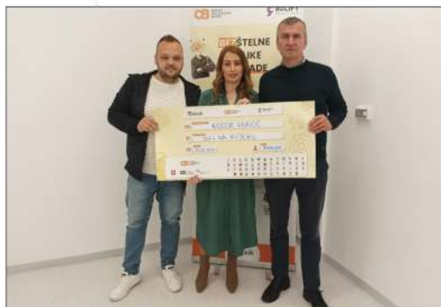
Пише: Милијана Радивојевић

Наведени пројекти биће реализовани у периоду од 15.04 до 15.07.2024. године.