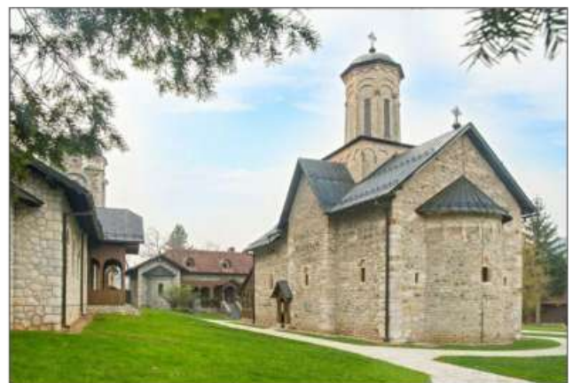
Пише: Вања Пејаковић

Легенда каже да је некада у стара времена у манастиру Липље било преко стотину калуђера. Данас у овом манастиру живе само четири душе.